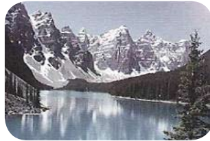
Klassische Sonnenschutzgläser Normale Sonnenschutzgläser vermindern helles Licht, aber reduzieren nicht die Blendung.

Mit Xperio-Gläsern sehen Sie die Welt in ihrer vollen Schönheit. Profitieren Sie von umfassender Farbtreue und optimalen Kontrasten.