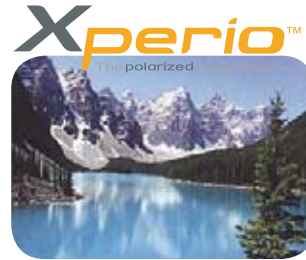
Xperio Sonnenschutzgläser Xperio Gläser geben Farben natürlich und unverfälscht wieder.

Dank dieser Sonnenschutz-Lösung können Sie entspannt die Sonne geniessen.