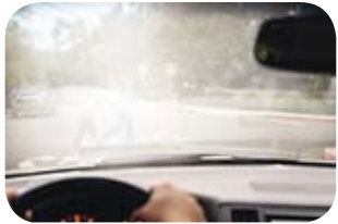
Klassische Sonnenschutzgläser Der Fahrer wird durch Blendung irritiert.

Ihre Sicherheit im Strassenverkehr kann durch blendendes Sonnenlicht vermindert werden.