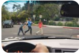
Xperio Sonnenschutzgläser Für höchste Sicherheit beseitigen Xperio Gläser Blendungen vollständig.

Xperio, die polarisierenden Sonnenschutzgläser von Essilor, schenken Ihnen einzigartiges visuelles Wohlbefinden und Sicherheit, indem sie gefährliche Spiegelungen - etwa auf einer nassen Strasse oder auf der Windschutzscheibe - eliminieren.